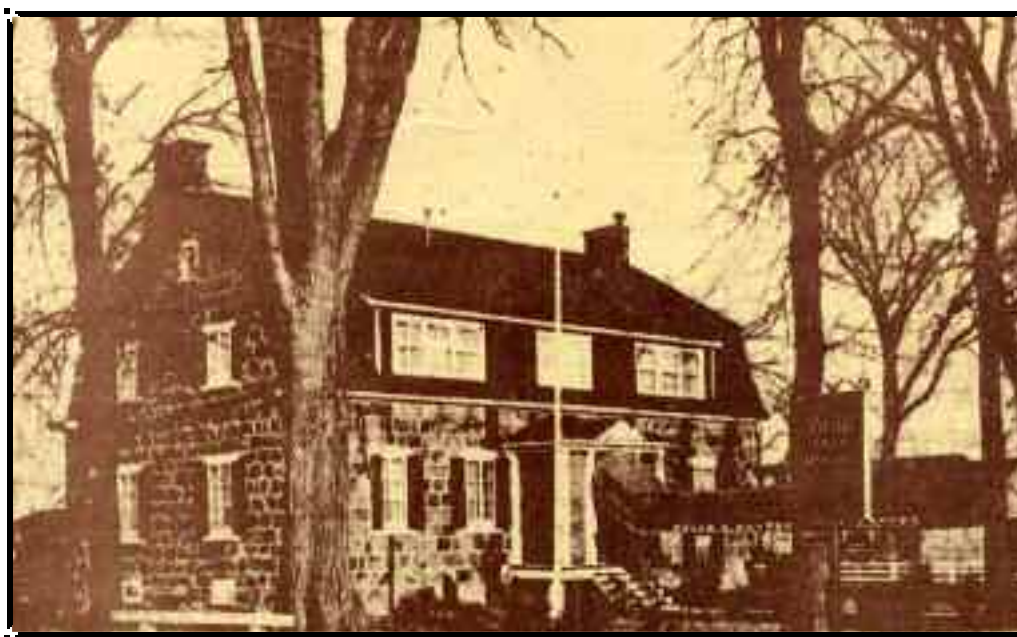
Restaurant l'Ancêtre vers les années 1970