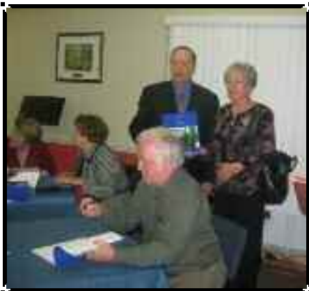
Séance de signature Domaine Bellerive en 2010.