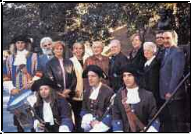
Monument à Charles-Lemoyne en 2001. Chemin de Chambly angle Sainte-Elizabeth.